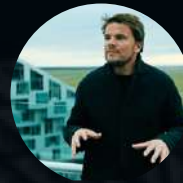
S1: E4. Bjarke Ingels ARQUITECTURA