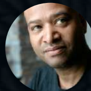
S1: E5. Ralph Gilles. DISEÑO AUTOMOTRIZ