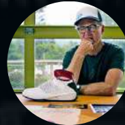
S1: E 2. Tinker Hatfield DISEÑO DE CALZADO