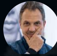
S1: E7. Platon. FOTOGRAFÍA