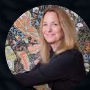
S1: E6. Paula Scher. DISEÑO GRÁFICO