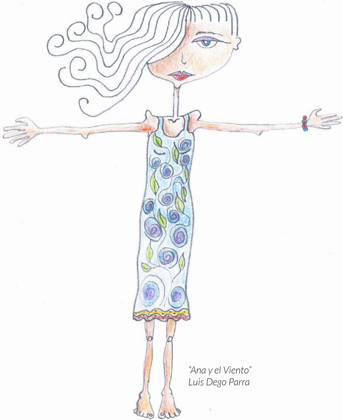
"Ana y el Viento" Luis Dego Parra