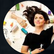
S1: E3. Es Devlin DISEÑO DE ESCENARIOS