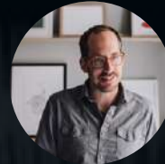
S1: E1. Christoph Niemann ILUSTRACIÓN

Además, muestra la importancia de amar lo que se estudia, no solo porque nos da de comer, sino porque cada segundo frente a ese cuaderno de dibujo, computadora o cámara debe reflejar lo que se quiere transmitir, los deseos por lograr para la marca y el producto. Los invito a verlo no solamente como entretenimiento, véanlo como una oportunidad para interiorizar y definir si realmente están felices con la decisión de estudiar.